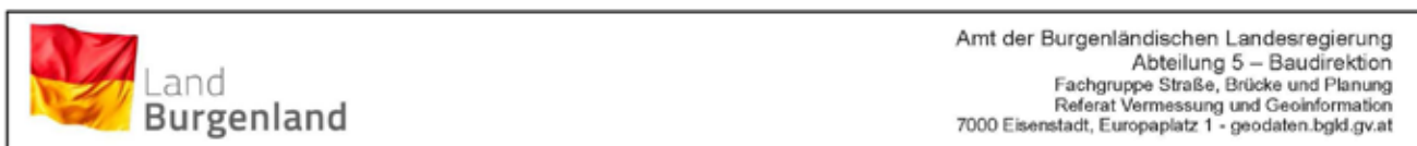
Güterweg Pamhagen-Apetlon, OA Pamhagen

Fahrtrichtung Grenze 18.018 PKWs und 1.436 Sonstige Fahrzeuge