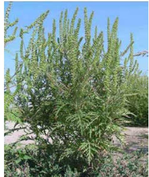
Typische Wuchsform

Eine Bekämpfung ist wichtig , weil jede einzelne Ragweed-Pflanze bis zu 60.000 Samen bilden kann, die bis zu 40 Jahre keimfähig sind und so zur rasanten Ausbreitung und zur Erhöhung der Gesundheitsbelastung beitragen. Die beste Bekämpfungsmethode ist, die Pflanze vor der Blüte ausreißen und in der Sonne verdorren lassen.