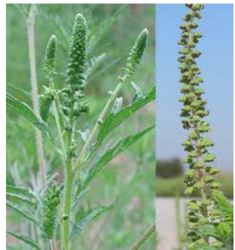
Blütenstand: vor der Blüte (links) und während der Blüte (rechts)